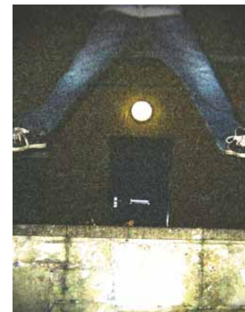
Photomission, Ffotograffau a gynhyrchwyd gan Ganolfan Pobl Ifanc Bryn-teg

Mae'r arddangosfeydd hyn yn cynnwys gwaith a grëwyd gan blant a phobl ifanc Wrecsam.