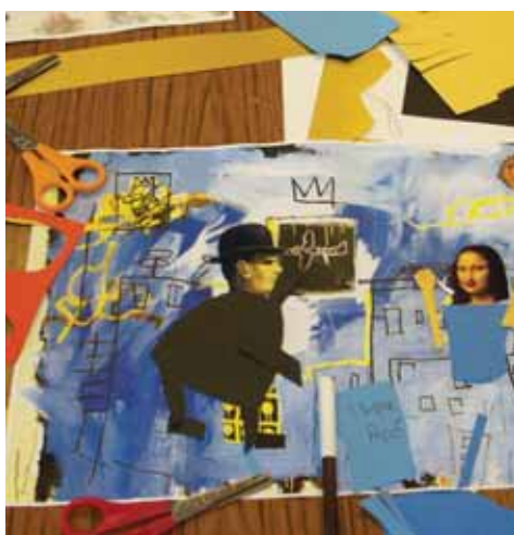
Darn paratoadol ar gyfer ffilm a gynhyrchwyd yn ystod gweithdy Ffilmiau Campwaith

Casgliad o ffilmiau byr a grëwyd gan bobl ifanc mewn amrywiol weithdai gwneud ffilmiau yn Oriel Wrecsam. Seiliwyd y ffilmiau ar storïau byrion a'u cynhyrchu trwy ddefnyddio animeiddiad atal symudiad a ffotograffiaeth datguddiad hir.