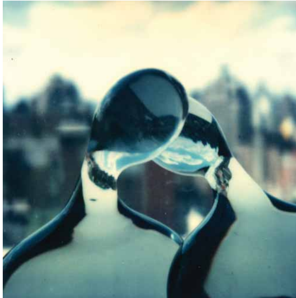
André Kertész, Awst 16, 1979, Fotograff Polaroid SX-70, Ystad André Kertész, Higher Pictures. Trwy garedigwydd Stephen Bulger Gallery