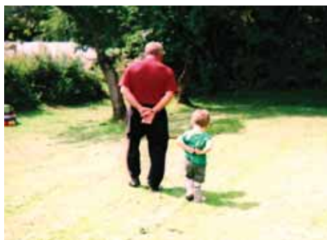
Photomission, Ffotograffau a gynhyrchwyd gan Ganolfan Pobl Ifanc Bryn-teg

Y pethau, arwyddion a symbolau bob dydd sy'n rhoi ystyr ond sy'n mynd yn ddisylw yw ffynhonnell ysbrydoliaeth yn y casgliad hwn o ddelweddau.