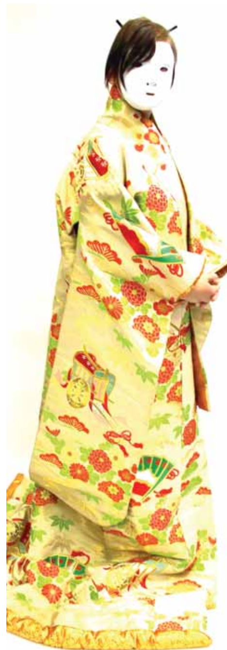
Yr Hunan fel Gwrthrych, Jordan