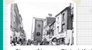
Cip yn ôl ar yr Eisteddfod Genedlaethol ddiwethaf yn Wrecsam dros 30 mlynedd yn ôl