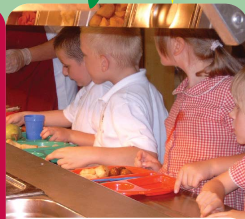
Y plant yn aros i gael eu cinio blasus