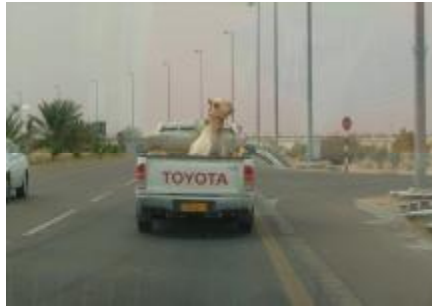
Mae'n amlwg nad yw gyrrwr y cerbyd hwn wedi cael ei hyfforddiant eto!!

Dau goleg sy'n cynnig hyfforddiant yn y maes yma yw:-