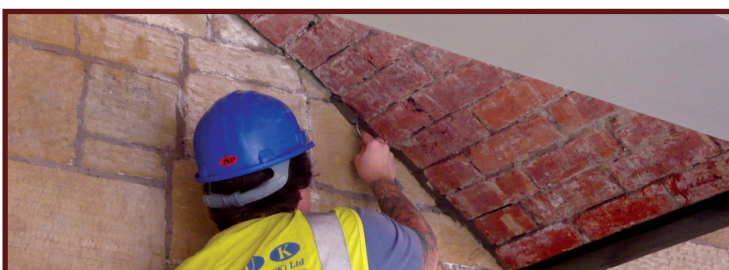
Pwyntio'r bricwaith y tu mewn i'r logia blaen.

I bob golwg, o'r tu allan, mae'r amgueddfa wedi'i chwblhau, ond da chi byddwch yn amyneddgar â ni. Mae gennym gryn dipyn o waith i'w wneud o hyd y tu mewn i'r adeilad cyn y gallwn ni ailagor i'r cyhoedd.