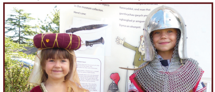
Marchog ifanc a'i riain deg, yn ffair bentref Gresffordd

Mae hyn wedi bod yn llwyddiant ysgubol ac mae pawb - yr hen a'r ifanc - wedi cael cyfle i wisgo amdanynt mewn gwisgoedd hanesyddol, trefnu fesul dau y bobl a'r gwrthrychau o Wrecsam yn yr oes a fu (e.e. John Wilkinson a'i fagnel), rhoi prawf ar faint yr oeddent yn ei wybod am ddigwyddiadau lleol a phryd y gwnaethant ddigwydd, ac enwi'r lleoedd hynny a welsant mewn hen ffotograffau. Cafodd pawb hwyl aruthrol arni!