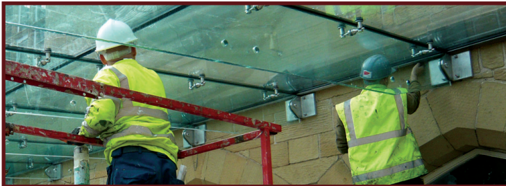
Sicrhau bod yr estyniad gwydr yn dal dwr.

Mae'r estyniad gwydr newydd wedi'i osod, mae'r orielau newydd yn barod i gael eu gosod ac mae'r toiledau newydd yn lân ac fel pin mewn papur.