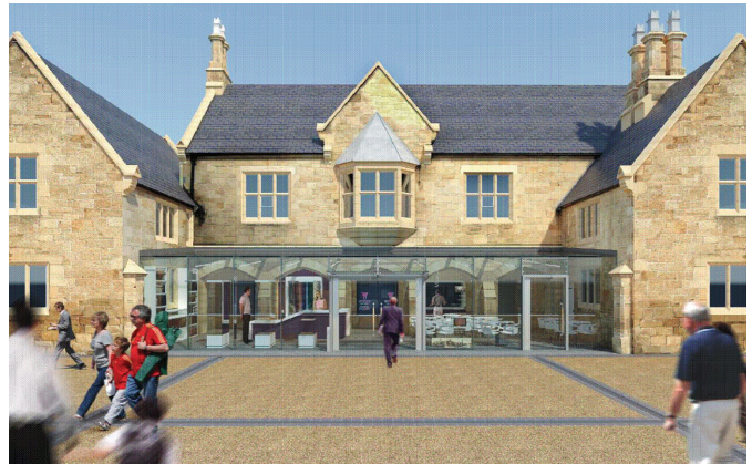
Estyniad blaen newydd yr amgueddfa