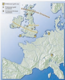
Map of embossed goldworking tradition Stuart Needham

Recent careful study of all gold fragments from this burial suggests that some do not belong to the cape. There were also fragments of another gold embossed artefact in this grave.