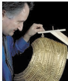
Man working on the cape British Museum