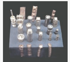
Tylwyr gwaith metel a darn treisiu'r Angweddif Brydeinig

Creodd gwarchodwr gyfres o dyllwyr arbennig a oedd yn cyfateb â'r amrywiaeth o siapau bogail addumiadol ar y fantell ar gyfer adluniai newydd o'r fantell yn 2002. Defnyddiwyd y rhain i argraffu llen gopr, a eurwyd yn ddiweddarach, i lenwi'r bylchau coll rhwng y darnau o'r fantell a oroesodd.