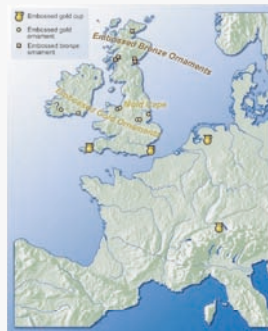
Map o draddodiad gwaith aur boglynnog Stuart Needham

Mae astudiaeth ofalus ddiweddar o bob darn aur o'r bedd hwn yn awgrymu nad yw rhai ohonynt yn perthyn i'r fantell hon. Roedd hefyd darnau o artefact boglynnog aur arall yn y bedd hwn.