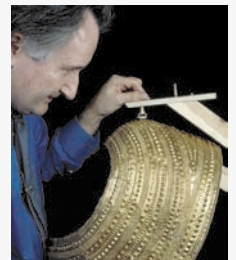
Man yn gweithio ar y fantell yn yr Angweddif Brydeinig