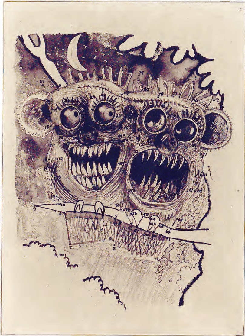
Fy Llyfr Lliwio Entlawr 20, 2004 Hawlfraint Jake a Dinos Chapman a Gwasg Paragon, Llundain