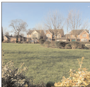
Ar gael mewn fformatau hygyrch ar gais.